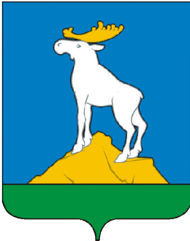
Схема водоотведения муниципального образования Нижнесергинское городское поселение на период до 2024 гг.