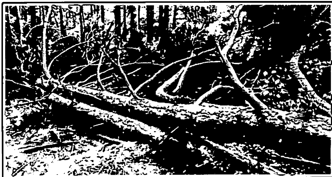
Лежащее на поверхности земли ветровальное дерево, не имеющее признаков отмирания. Не является валежником

Кроме того, необходимо обратить внимание, что деревья, которые лежат на земле, но не имеют признаков естественного отмирания (имеют зеленую листву или хвою), определять как «мертвые» не допускается (смотри изображение № 5).