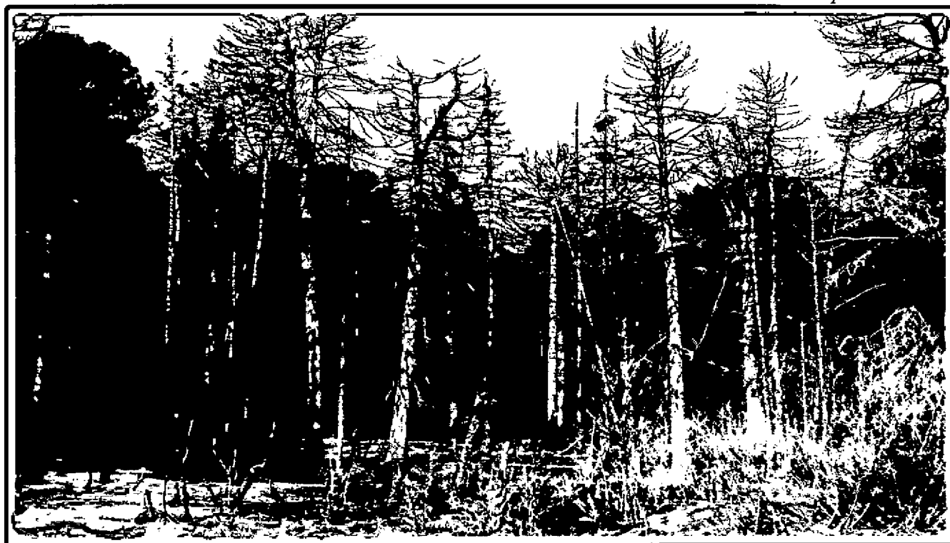
Изображение № 4 Сухостойное дерево. Не является валежником Изображение № 5

Кроме того, необходимо обратить внимание, что деревья, которые лежат на земле, но не имеют признаков естественного отмирания (имеют зеленую листву или хвою), определять как «мертвые» не допускается (смотри изображение № 5).